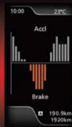
רישום של שימוש בדוושת ההאצה והבלמה