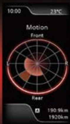
תצוגת מעקב אחר נתוני תאוצת הרכב