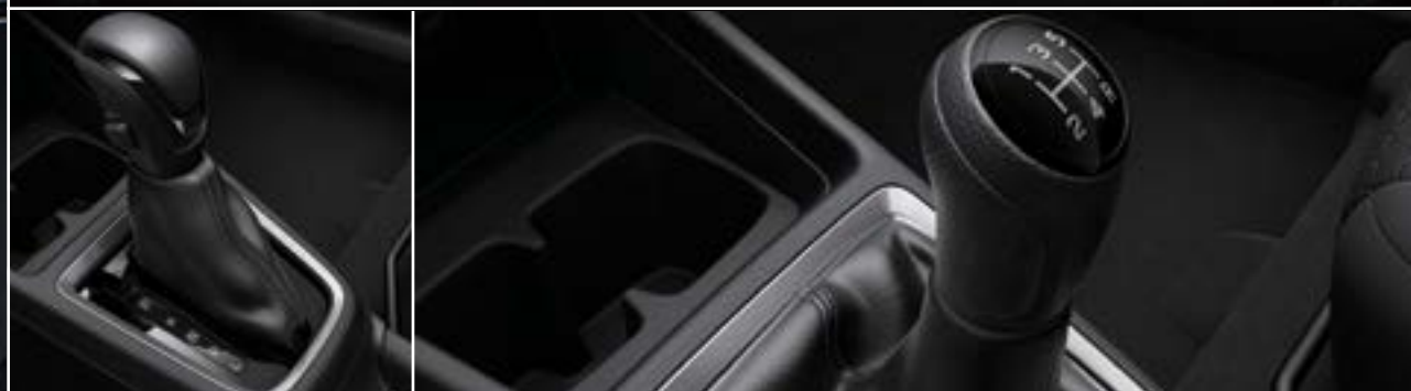
תיבת הילוכים ידנית

מרגע שהתיישבת, הדחף להמריא מתגבר מיד, הודות לעיצוב בתפיסת 'הנהג הוא במרכז' המיושמת בקפדנות. לגל ההגה בסגנון מכונית מרוץ, המעוצב בצורת ס, המושבים הקדמיים היציבים והקונסולה המרכזית הנטויה כלפי הנהג יוצרים סביבה ספורטיבית יותר באיכות גבוהה המאחדת את המכונית עם הנהג.