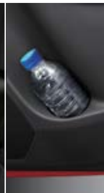
מנשא בקבוקים בדלתות האחוריות

בקרת אקלים עם צג נוח ובקרי פיקוד נוחים לשימוש לוח הבקרה של מיזוג האוויר מאפשר הפעלה אינטואיטיבית. שימוש בצג LCD עם ניגודיות גבוהה מאפשר זיהוי קל.