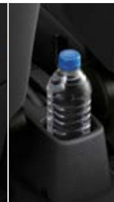
מנשא ספל אחורי