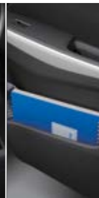
כיס אחסון בדלתות הקדמיות