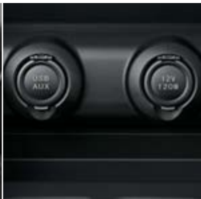
כניסת USB-1 ושקע AUX ושקע אביזרים