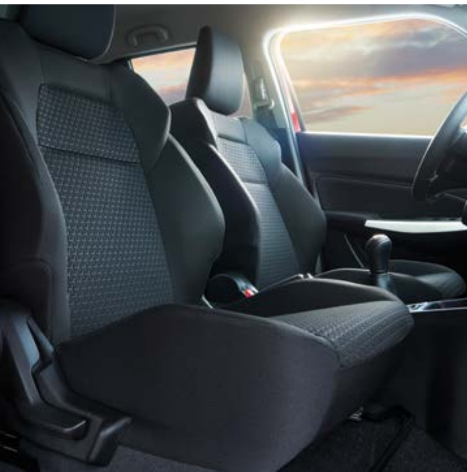
תא נהג מרווח