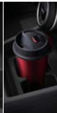
מנשא ספל קדמי 2x