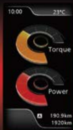
תצוגה בזמן אמת של הספק ומומנט