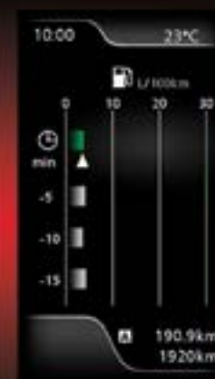
תצוגה של צריכת דלק ממוצעת נוכחית ובעבר