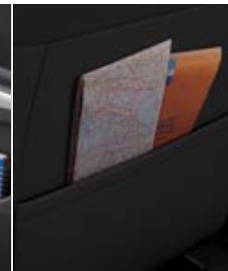
תא אחסון במשענת מושב הנוסע