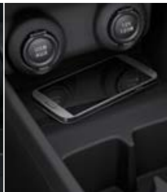
מגש אחסון מרכזי